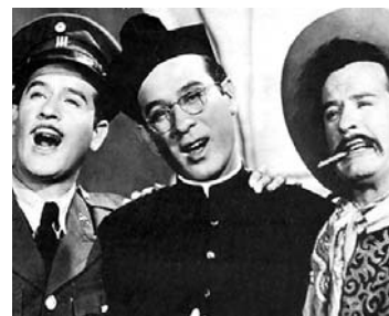
1948 LOS TRES HUASTECOS . Con pocos recursos logró grandes efectos.