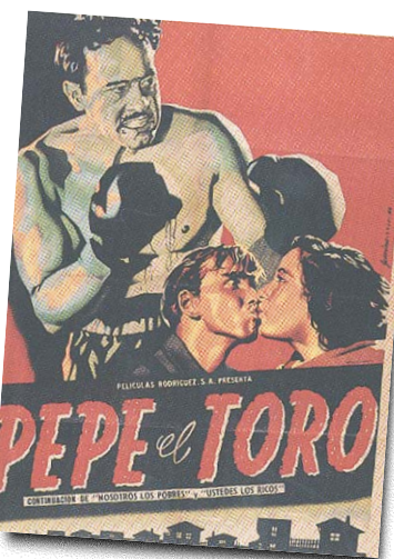
EL GRAN DESCUBRIMIENTO . Pedro Infante y sus películas son el mejor legado de Rodríguez.