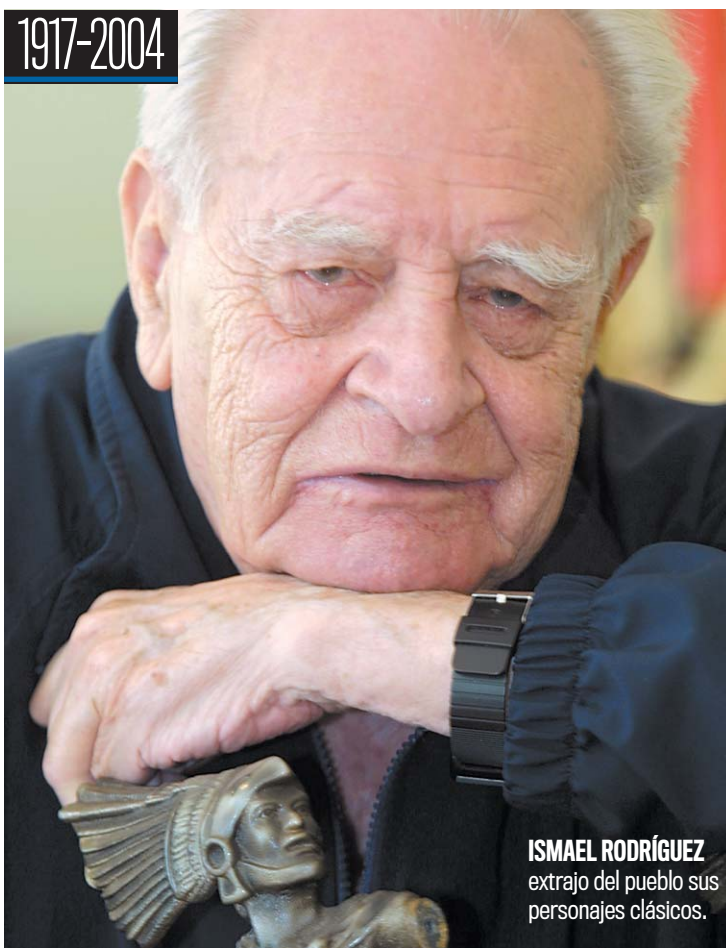
ISMAEL RODRÍGUEZ extrajo del pueblo sus personajes clásicos.

Para recordarlo, su hijo Ismael declaró al periódico Reforma en la funeraria donde velaron los restos del director: "Utilizando el humor negro que tanto le gustó a mi papá, seguramente ahorita se encuentra en el cielo con Pedro Infante y Pedro Armendáriz y diciéndoles: 'miren, allá están llorando, pero ya es la hora del amigo, así que vamos a tomarnos un trago'".