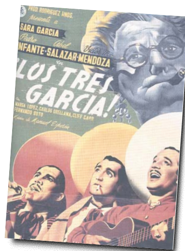
1947 LOS TRES GARCÍA . Consolidó a Sara García como la abuela de Pedro Infante.