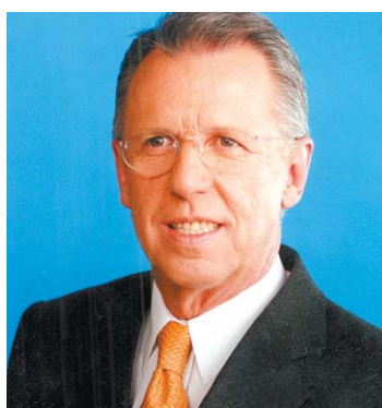
LÓPEZ DÓRIGA. Qué representan para México y Latinoamérica las elecciones.

Con un despliegue de corresponsales en diferentes puntos de EU, los canales en español brindan al televidente la información de la contienda electoral