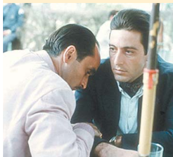
UN CLÁSICO. No se pierda The Godfather con Al Pacino.

Estas son algunas opciones que ofrece hoy la pantalla chica.