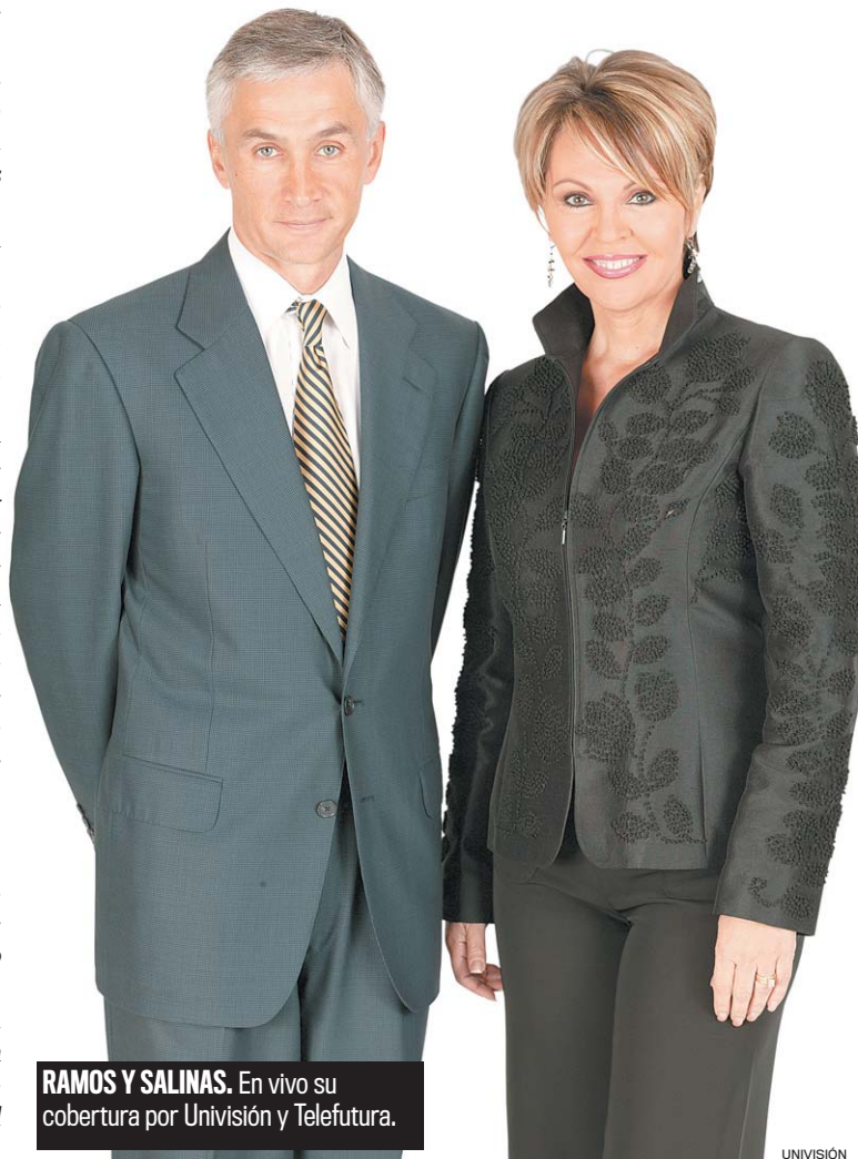
RAMOS Y SALINAS. En vivo su cobertura por Univisión y Telefutera.

De esta manera el público hispano puede seguir paso a paso el proceso electoral, un evento cuyos resultados afectan a cada uno de los habitantes de este país. Esté pendiente y entérese.