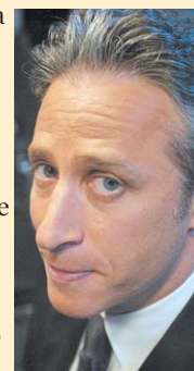
JON STEWART. Una cobertura fuera de lo común.

The Daily Show se ha convertido en una de las fuentes de información de millones de personas que noche a noche han disfrutado de los comentarios así como de los invitados, entre ellos destacados políticos, que han encontrado en la emisión una plataforma para llegar al público que no se conforma con la cobertura convencional de la política nacional e internacional. Jon Stewart junto a Bill Maher, Al Franken, Dennis Miller, Jay Leno y SNL, entre otros, han revolucionado la TV de hoy.